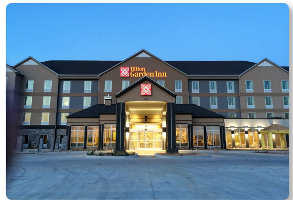
Hilton Garden Inn, Ardmore, OK