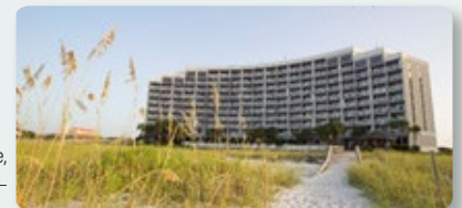
Island House, Orange Beach, AL