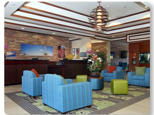
Fairfield Inn & Suites Alamogordo, New Mexico

Ubicado al borde del Bosque Nacional Lincoln cerca de las Montañas San Andrés, el hotel posee una ubicación estratégica junto a 2,900 pies cuadrados (269.4 m2) de espacios para convenciones que le dan la bienvenida a empresarios y turistas.