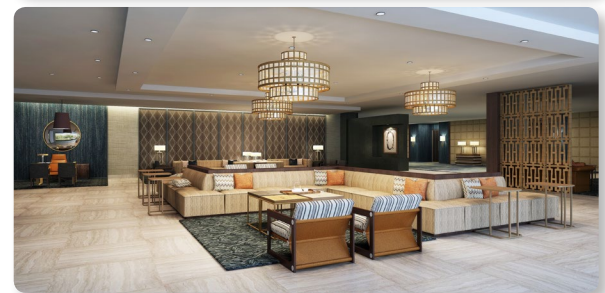
DoubleTree DFW Arlington South